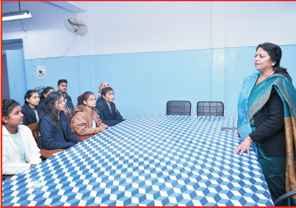
LECTURE ROOM OF OPTOMETRY