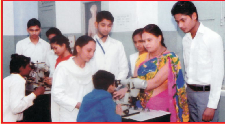
ओर्थोपेडिक्स विभाग में सिनेटोफोर पर प्रशिक्षण प्राप्त करते विद्यार्थी